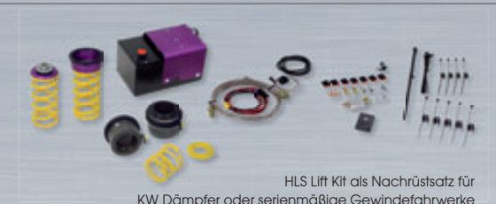
HLS Lift Kit als Nachrüstsatz für KW Dämpfer oder serienmäßige Gewindefahrwerke HLS Lift kit conversion kit for KW or OEM coilover kits