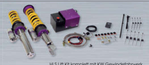
HLS Lift Kit komplett mit KW Gewindefahrwerk Complete HLS Lift kit including KW coilover kit

Depending on the car type and model, the HLS Lift Kit is either available as a vehicle-specific solution or as a conversion kit for KW or OEM coilover kits existing of springs, adaptions, hydraulic cylinder and contol unit.